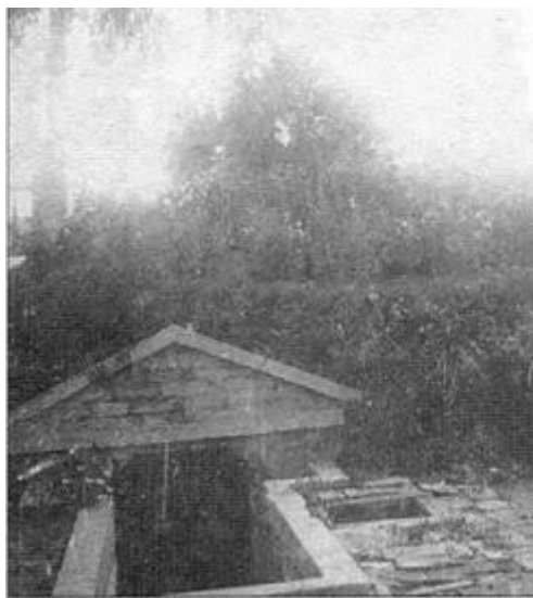
A csurgó-kápolna az 1950-es években