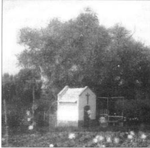
Virágoskert a kegyhely körül az 1950-es évek elején

A jelenések kivizsgálása után Klobusiczky Péter kalocsai és bécsi érsek 1838-ban szentelte fel és nyilvánította zarándokhellyé Vodica-Máriakertet. A XIX. század vége felé a kegyhely környezetében szőlőskerteket telepítettek, amelyeket a II. világháború után fokozatosan megszüntettek, és napjainkra szántóföldi növénytermesztés jellemzi a határrészt.