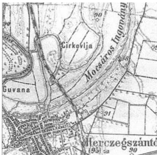
A kegyhely a Mocsáros Ingovány partján, 88-as magassági jelű pontnál fekszik (első világháború utáni térkép)

Egykor a jószágot az itteni réten legeltették és a területen ásott kút vizéből itták.