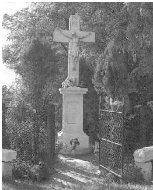
A Vodica-Máriakerthez vezető útleágazás elején álló kökereszt